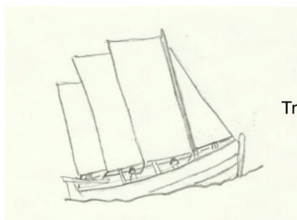
Tremänning från Gotland

Här en bild från båtbyggerverkstaden i miniformat från mässan. Det var oroligt fint gjort men utan flaska. Han är inbjuden att besöka oss någon gång.