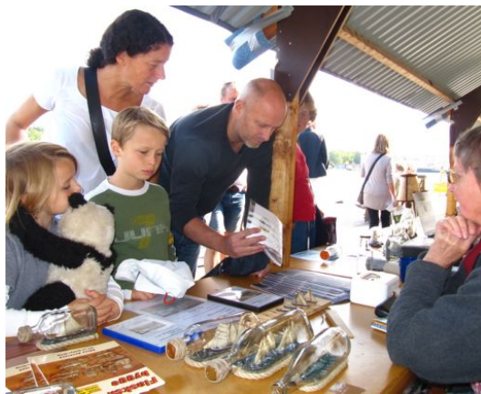
Det blir nog köp av en byggsats!