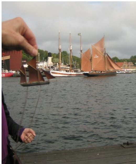
Verkligheten möter flåskäppsmodell