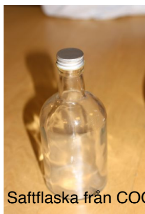
Saftflaska från COOP