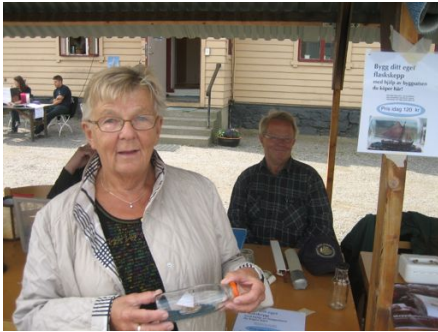
Damen som köpte byggsats på julnautikan och hade den färdig nu.