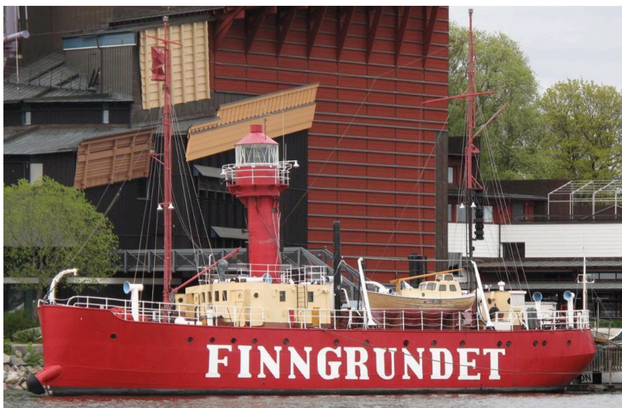
Verklighetens fyrskepp vid Wasamuseet i Stockholm