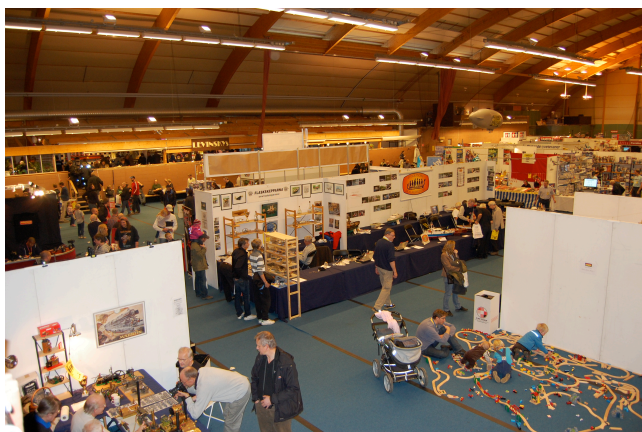
Så här mitt i mässområdet hade Flaskskepparna sin monter perfekt placerad. Vi delade monter med Skalabåtsklubben, som också köpt in de blå dukarna till oss.