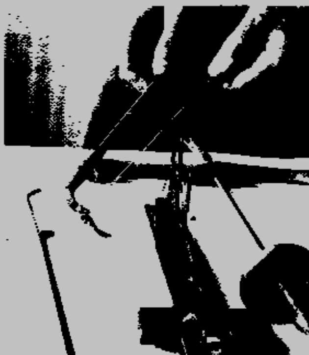
Några av Björns specialverityg, en fjäderände pincett som manövereras med ett snöre, tillagda pinset, byggborst och utmålsborst.