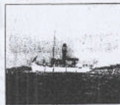
Ångare. Ångaren "Ytterfors 3". Oljemålning av Gregor Hellberg, Helsingborg.