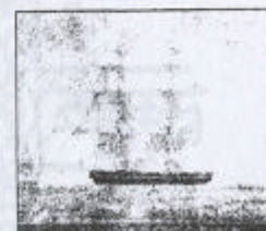
Brigg. Briggen "Agathon". Oljemålning av okänd konstnär.