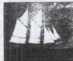
Skonare. Skonaren "Huldia". Oljemålning av Folke Fahlgren, Skellefteå.